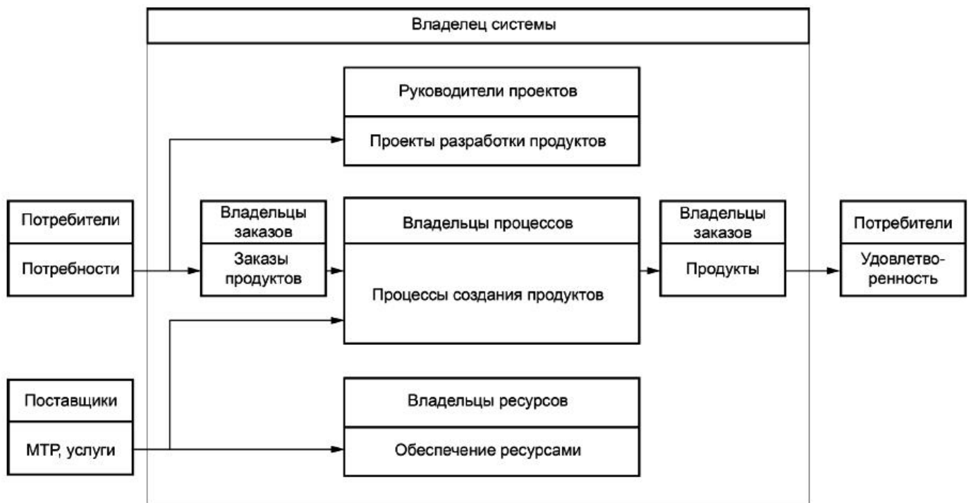
Рисунок 4 - Схема выполнения внешнего заказа в организации