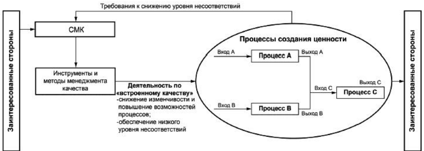
Рисунок 1 - Применение менеджмента качества при производстве продукции/оказании услуг

4.2.2 Применение методов и инструментов БП ( ГОСТ Р 56407 ) направлено на повышение эффективности процессов, составляющих поток создания ценности (например, на их синхронизацию, сокращение времени и стоимости), и обеспечение их соответствия уровню спроса ( ГОСТ Р 56906 - ГОСТ Р 56908 ). Применение подходов БП позволяет улучшать временные и стоимостные характеристики процессов, составляющих поток создания ценности, и повышает эффективность деятельности: